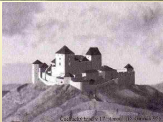
Čachtický hrad v 17. storočí (D. Gurniak 95)