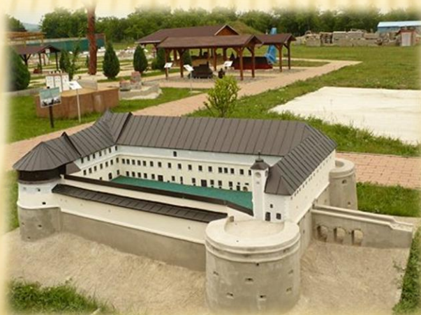
Hrad Červený Kameň