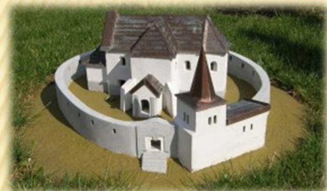
Kostolík v Lančári