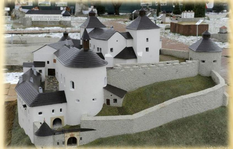
Hrad Krásna Hôrka