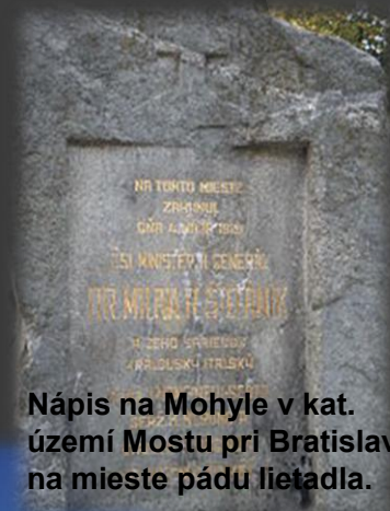
Nápis na Mohyle v kat. území Mostu pri Bratislave na mieste pádu lietadla.