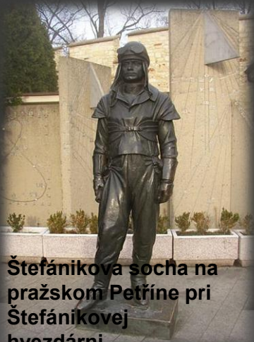
Štefánikova socha na pražskom Petříne pri Štefánikovej hviezdárni.