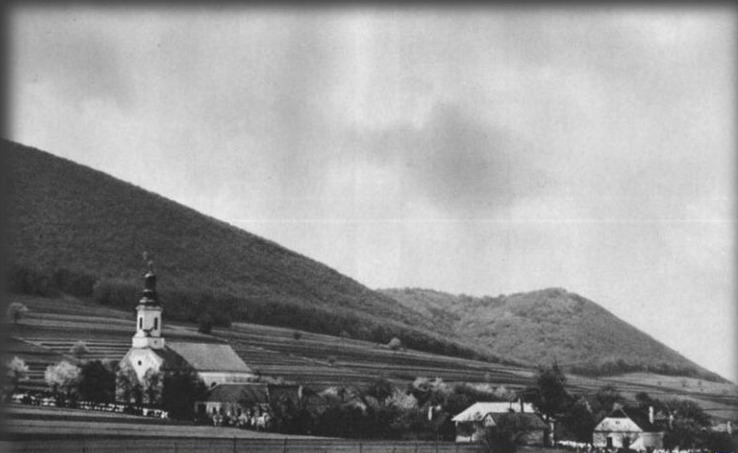
Košariská - rodisko M. R. Štefánika