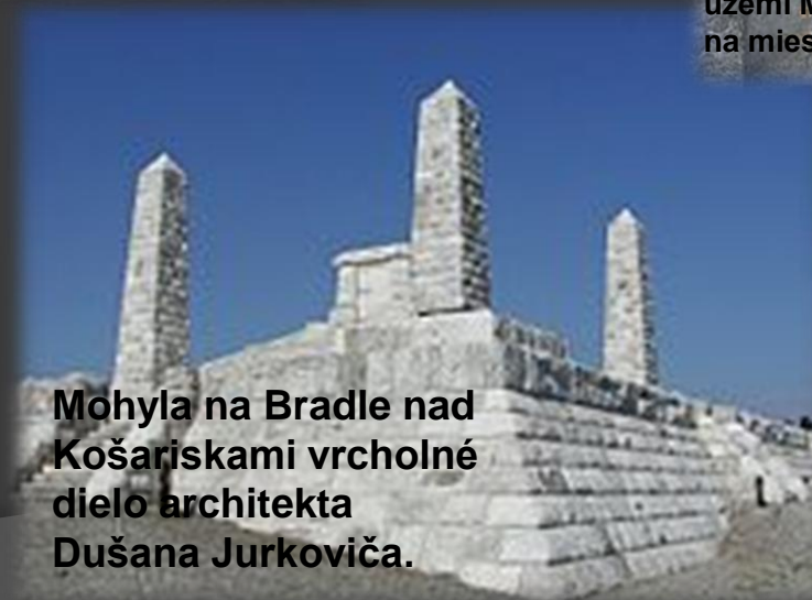
Mohyla na Bradle nad Košariskami vrcholné dielo architekta Dušana Jurkoviča.