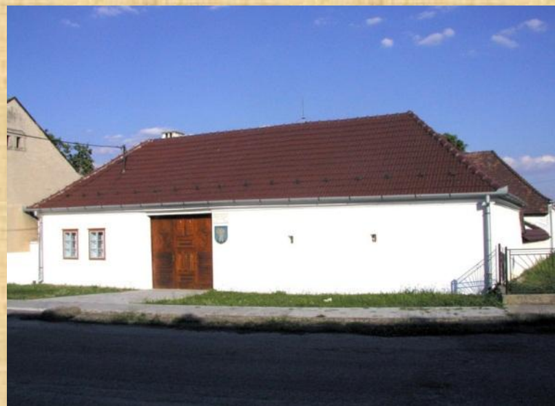
Dom v dnešnej podobe