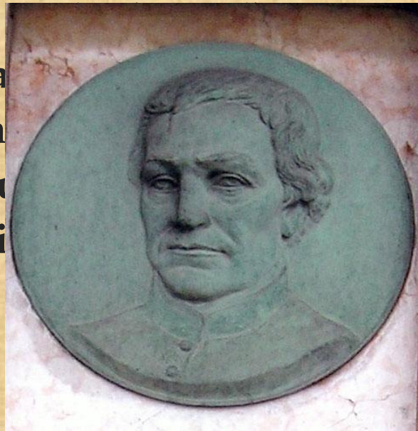
Pamätná tabuľa Jána Hollého