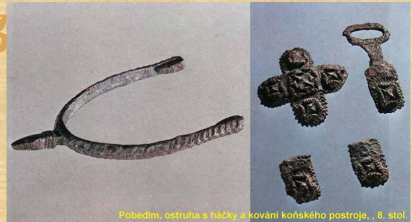
Pobedim, ostruha s háčky a kování koňského postroje, , 8. stol.